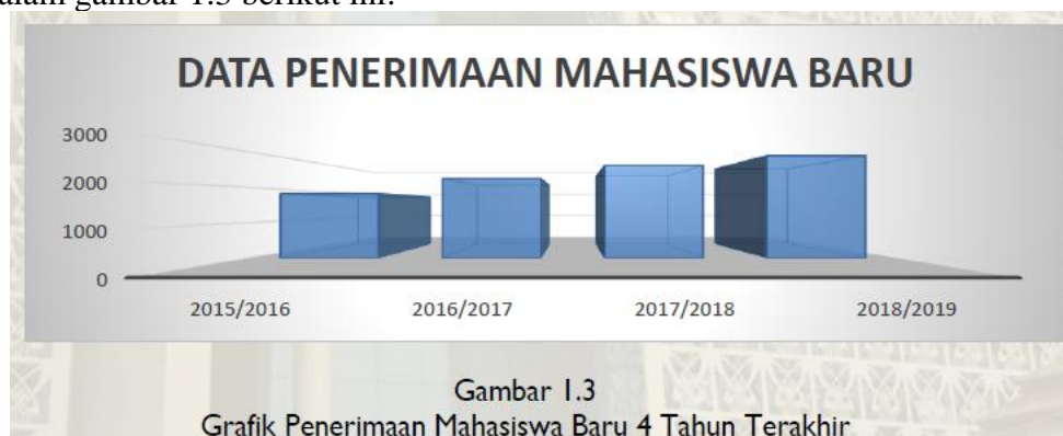
Gambar 1.3 Grafik Penerimaan Mahasiswa Baru 4 Tahun Terakhir

Pada tahun akademik 2018/2019, jumlah mahasiswa baru S1 mencapai 2.888 orang dari jalur penerimaan SPAN PTKIN, UM-PTKIN dan PCMB, meningkat sebesar 10% dari tahun sebelumnya, yaitu 2.617 orang. Grafik penerimaan mahasiswa baru 4 tahun terakhir yang tersaji dalam gambar 1.3 berikut ini: